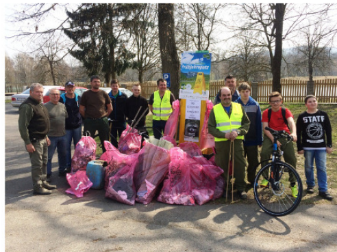
Misselsdorf / Gosdorf