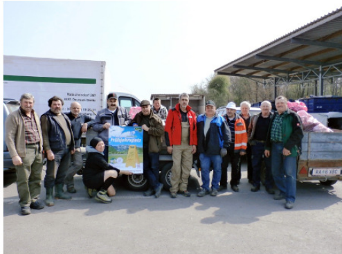
Berg- und Naturwacht Deutsch Goritz