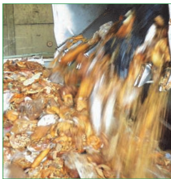
„Unser täglich Brot!?!“

Jeder von uns hat es selbst in der Hand! Niemand braucht zu warten, bis ein anderer etwas ändert. Der Handel sagt: „Der Konsument bestimmt die Waren.“ Zeigen wir also, was wir wirklich wollen! Umweltschutz braucht alle!