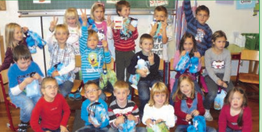
Die Kinder sind voller Begeisterung dabei und freuen sich über das Jausenset - Ein aktiver Beitrag zur Abfallvermeidung!