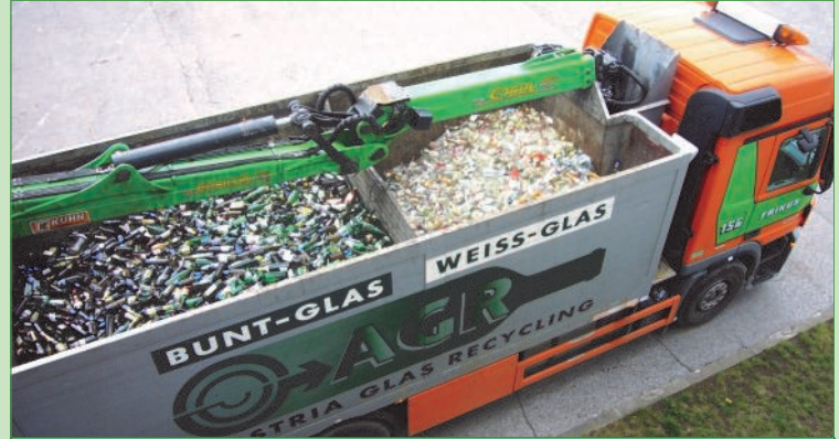
Verpackungsglas, getrennt gesammelt und transportiert, für den perfekten Kreislauf

Wenn das mit dem Glasrecycling noch nicht erfunden wäre, ich würde es glatt erfinden. Super ist nämlich, dass man die Glasverpackungen nicht in den Müll werfen