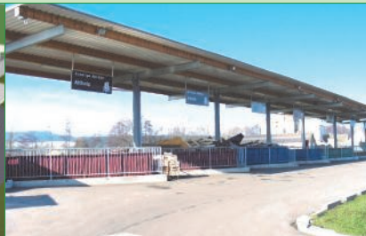
Betrieb in OÖ

Nicht nur die Gemeinden sehen im Regionalen Bezirkssammelzentrum einen Vorteil, sondern jede und jeder Einzelne von uns gewinnt! Natürlich, das soll nicht unerwähnt bleiben, müssen einige längere Fahrtstrecken in Kauf nehmen. Aber viele Wege lassen sich verbinden, sodass nicht immer eine eigene Fahrt für das Abfallentsorgen notwendig wird. Das schont auch Umwelt- und Energieressourcen! Vielleicht denken wir ab nächsten Herbst verstärkt daran, wenn wir in die verschiedensten Einkaufszentren fahren, gleichzeitig auch schnell unseren Abfall im ASZ vorbei zu bringen.