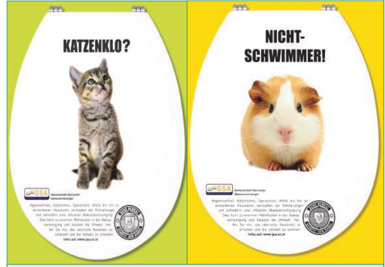
Info-Kampagne der GSA - Gemeinschaft Steirischer Abwasserentsorger

benutzungsgebühren dauerhaft zu senken. Die Initiative wird von der Gemeinschaft Steirischer Abwasserentsorger (GSA) getragen. Weitere Infos unter: www.gsa.or.at