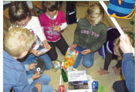
Welcher Abfall gehört in welche Mülltonne? Gar nicht so einfach!

Zu Schulbeginn verteilte der AWW Radkersburg wieder die bunte Trinkflasche „Emil die Flasche“ und eine Jausenbox im Stoffsackerl. Mit den Kindern wird das richtige Abfalltrennen besprochen und auch geübt. Als Anerkennung und vor allem als Beitrag zur Abfallvermeidung wird zum Schluss ein Jausenset verschenkt. Mit dem Jausenset soll eine Möglichkeit für die Kinder und Eltern geschaffen werden um Dosen, PET Flaschen oder Alu- u. Kunststofffolien zu vermeiden. Fotos vom Projekt finden Sie auf unserer Webseite oder folgen Sie uns auf Facebook.