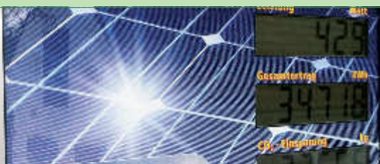
Anzeigetafel und E-Ladestation im regionalen ASZ