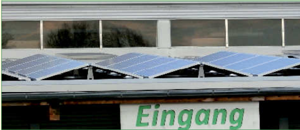
Ende Jänner ging die Photovoltaikanlage auf dem Hallendach des regionalen ASZ in Betrieb

Der Abfallwirtschaftsverband (AWV) Radkersburg setzt auf eigenen, umweltfreundlichen Strom. Eine 10,4 kWp Photovoltaikanlage wurde Ende Jänner 2016 im Altstoffsammelzentrum (ASZ) in Betrieb genommen.