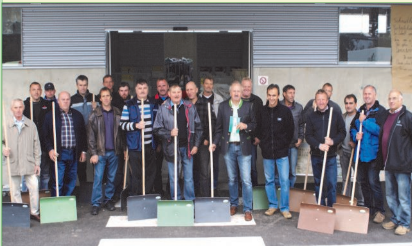
Die Gemeindearbeiter waren vom regionalen ASZ sehr begeistert

Der Abfallwirtschaftsverband Radkersburg bedankte sich bei allen Gemeindearbeitern mit einer Dank- und Anerkennungsurkunde für die jahrelange gemeinsame Arbeit im Bereich der Abfallwirtschaft in den einzelnen Gemeinden. Als kleines Geschenk gab es einen Schneeschieber, der standesgemäß aus alten Mülltonnen hergestellt wurde.