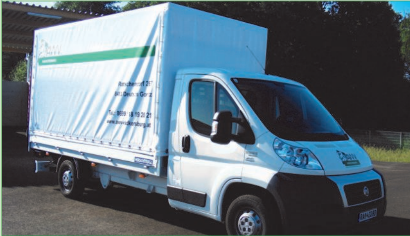
Transporter mit Hebebühne des AWW Radkersburg - B-Führerschein

Unter folgender Telefonnummer - 0699/ 18 19 20 21 - können Sie den Transporter des AWW Radkersburg reservieren. Mit einem Versicherungsbeitrag von 10 Euro können Sie max. 3 Stunden bzw. max. 60 Kilometer fahren.