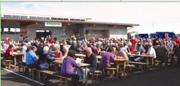
Viele Besucher nutzten die Gelegenheit und informierten sich über das reg. ASZ