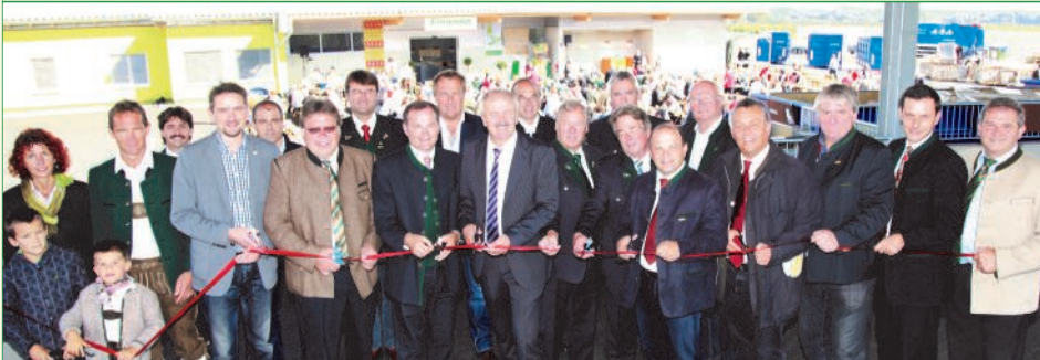
Feierlich wurde das regionale Altstoffsammelzentrum in Ratschendorf eröffnet

Ein großer Tag für den Abfallwirtschaftsverband Radkersburg und seine Mitgliedsgemeinden. Bei herrlichem Herbstwetter wurde das regionale Altstoffsammelzentrum (ASZ) in Ratschendorf am 22. September 2012 eingeweiht und seiner Bestimmung übergeben.