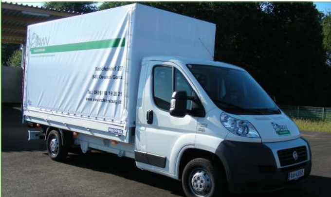
Transporter mit Hebebühne des AWV Radkersburg - B-Führerschein

Unter folgender Telefonnummer - 0699/ 18 19 20 21 - können Sie den Transporter des AWV Radkersburg reservieren. Mit einem Versicherungsbeitrag von 10 Euro können Sie max. 3 Stunden bzw. max. 60 Kilometer fahren.