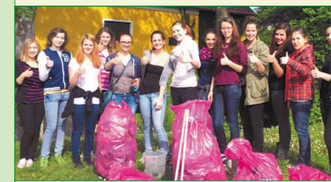
Die SchülerInnen der HLW/BFW Mureck finden die Aktion super!

Der QR-Code führt Sie direkt zur Fanpage auf Facebook.