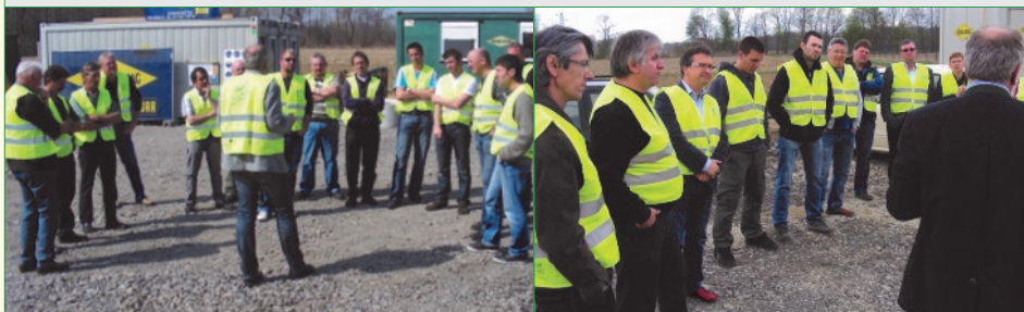
Begeisterung über die gute Umsetzung bei den Baustellenbesichtigungen

Das Herzstück der Anlage - die Sägezahnrampe - einfaches Entsorgen sperriger Abfälle