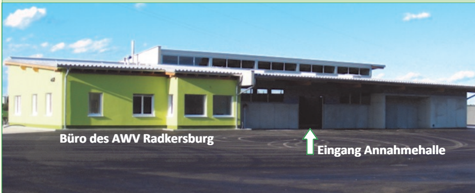
Büro des AWV Radkersburg

Schon bald ist es soweit! Das regionale Altstoffsammelzentrum des AWV Radkersburg wird noch im Frühherbst seine Tore für einen ersten Probebetrieb öffnen. Dann beginnt die „NEUE Abfallkultur“! Das aktuelle Umweltforum widmet sich fast ausschließlich der neuen, modernen Abfallbewirtschaftung. Lesen Sie dazu die vielen Informationen im Blattinneren!