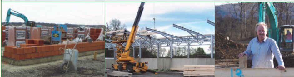
Die Bauphase hat Ende Februar begonnen - nun sind die großen Bauarbeiten abgeschlossen