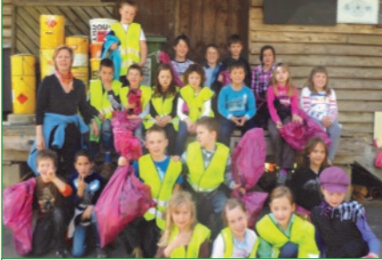
VS Dietersdorf am Gnasbach