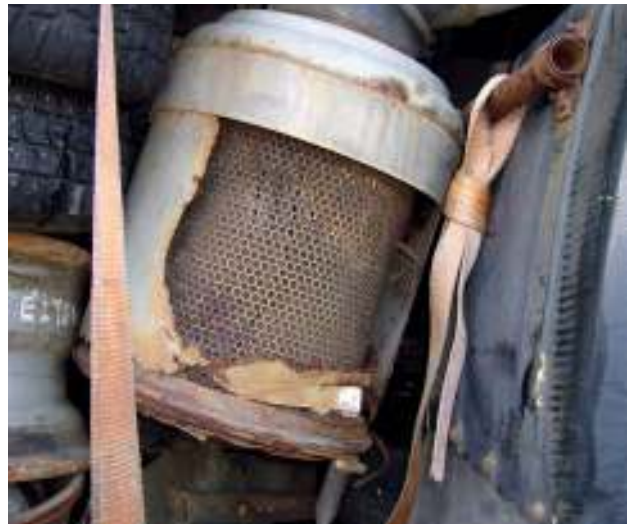
Alter Auspuff und diverse Bauteile sowie Altreifen - Abfall Old muffler and various components as well as waste tires - waste