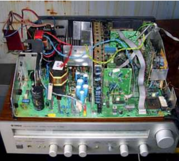
Altgerät und bestückte Leiterplatte - Abfall WEEE and populated printed circuit board - waste