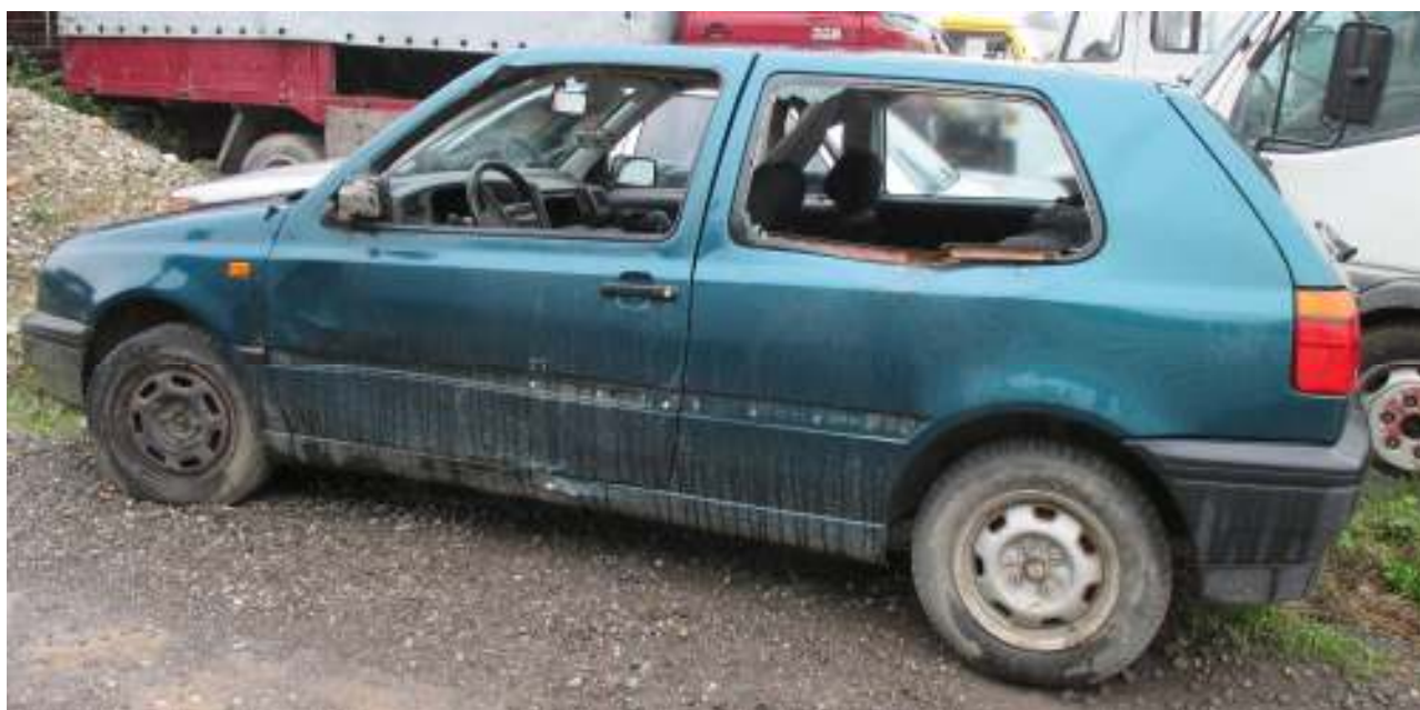
Teilausgeschlachtetes Altfahrzeug – gefährlicher Abfall; Partially dismantled end-of-life vehicle – hazardous waste

Thus not only for the determination of the present market value of the vehicle and the repair expenses the country where the used or end-of life vehicle is located at the time of the determination of these factors is of relevance, but it is generally necessary to assess the compliance with national technical regulations in Austria.