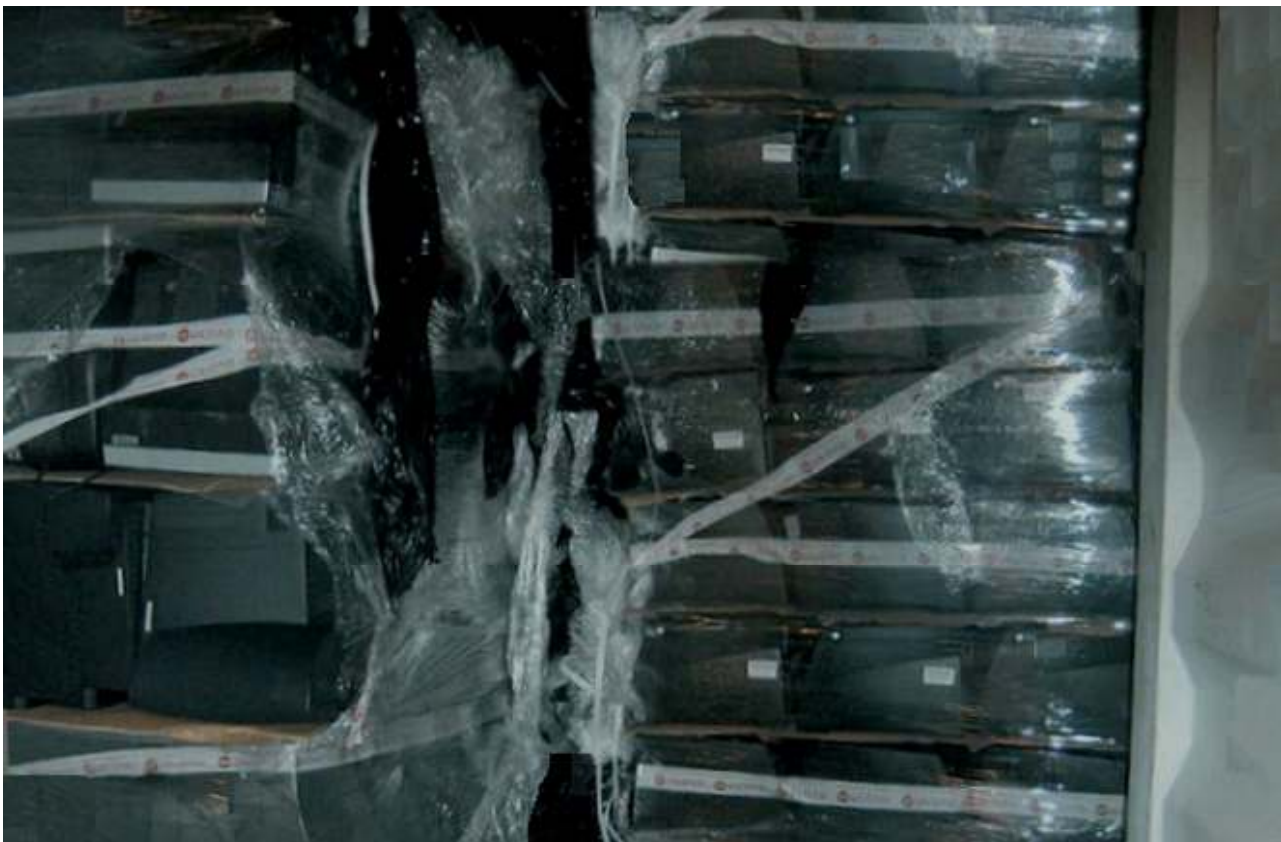
Ausreichende Verpackung und Vorlage eines Nachweises der Funktionsfähigkeit sind essentiell für die Klassifikation als Nichtabfall Sufficient packaging and certificate of testing are essential elements for the classification as non-waste