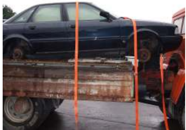
Aufgeladener PKW, dessen Reparaturkosten höher sind als der Fahrzeugwert (auch Ölverluste) - gefährlicher Abfall Loaded car whose repair costs exceed the present value of the vehicle (also oil loss) - hazardous waste.