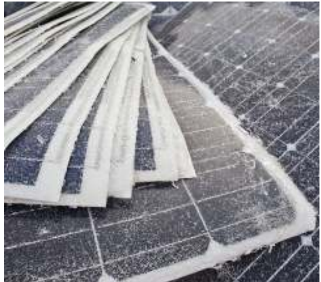
Beschädigte Photovoltaikzellen – Abfall Damaged photovoltaic cells - waste