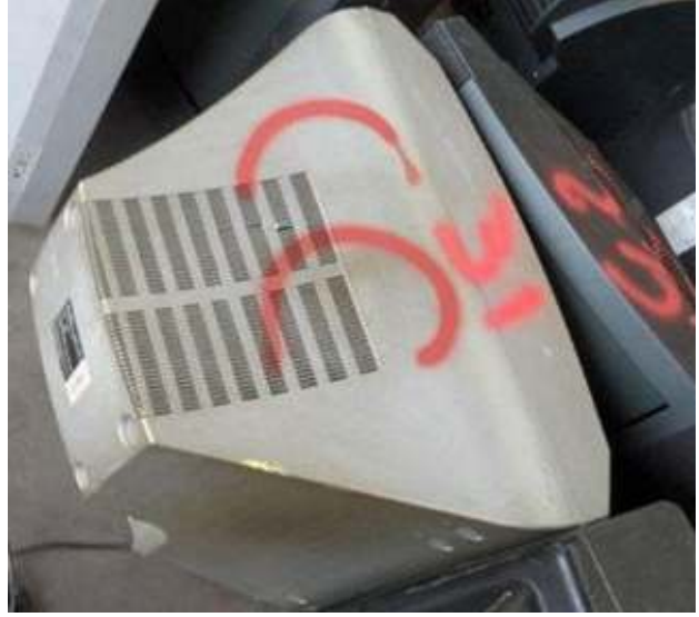
Gebrauchte Monitore mit abgeschnittenen Netzkabeln, kein Prüfzertifikat der Testung - gefährlicher Abfall Used monitors, power cables cut-off, no certificate of testing - hazardous waste