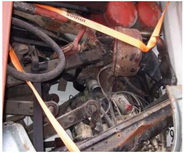
Gemischte alte Karosserie- und Bauteile, dahinter befindet sich ein alter Kleinbus - Abfall / gefährlicher Abfall Mixed old car body panels and components; behind, there is an old minibus - waste / hazardous waste