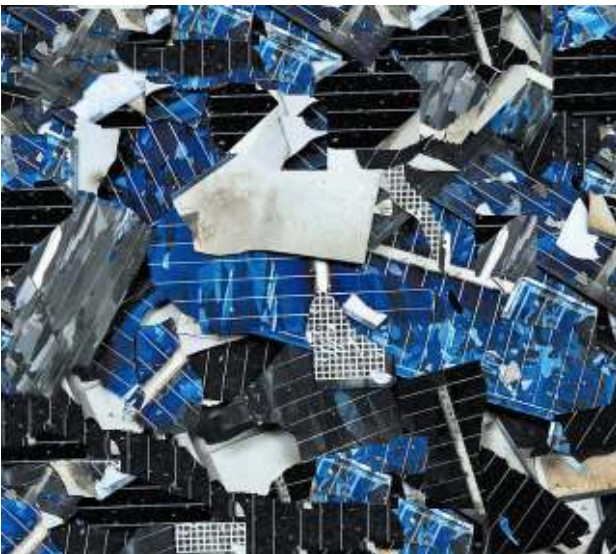
Zerbrochene Photovoltaikzellen – Abfall Broken photovoltaic cells - waste