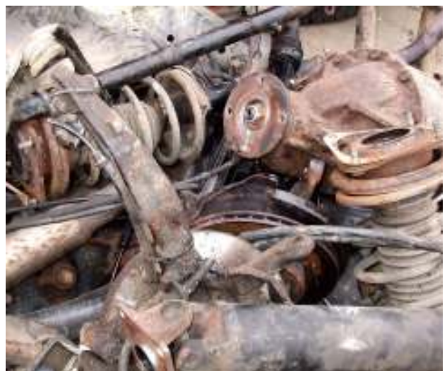
Gemischte alte Bauteile - Abfall Mixed old car components - waste