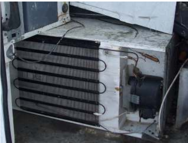
Diverse Altkühlgeräte ohne Ladungssicherung oder Verpackung, ohne Testzertifikat – gefährlicher Abfall Different types of waste refrigerators not securely stapled /no packaging, no certificate of testing – hazardous waste

http://www.bmlfuw.gv.at/umwelt/abfall-ressourcen/abfallverbringung/gruene_liste.html