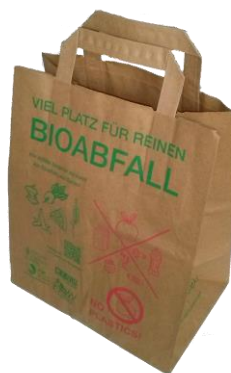
Kraftpapiersäcke - die praktische Lösung für die Bioabfallsammlung

Diese 8 Liter Säcke mit Henkel bestehen aus Recyclingpapier, sind extra nassfest und haben einen doppelt verklebten Boden, um die Dichtheit noch zu verstärken. Sie sind gemäß den Normen EN 13593 und EN 13432 kompostierbar. So ergibt sich der große Vorteil, dass der Bioabfall ohne weiteres Gefäß zur Biotonne