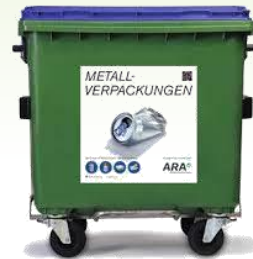
Metallverpackungen (Aluminium, Weißblech)