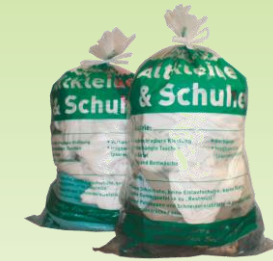
Altkleider & Schuhe