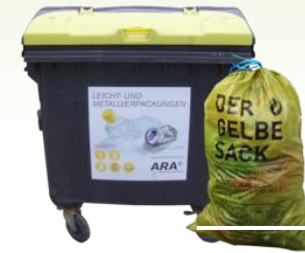
ALLE anderen Verpackungen (Kunststoffe, Verbundstoffe, Holz)