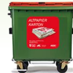
Papier und Kartonagen