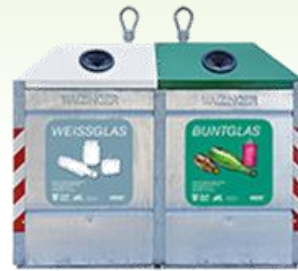
Glasverpackungen (in Bunt- und Weißglas trennen)